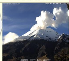
Imagen destacada de las últimas 24 horas

CON LA PARTICIPACIÓN DEL INSTITUTO DE GEOFÍSICA DE LA UNAM